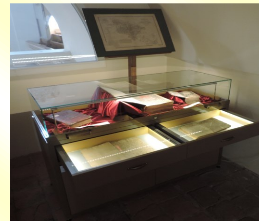
Muzeum Protestantyzmu – nowa gablota

Zadania te wzbogacają produkty turystyczne oraz wzmacniają i spajają współpracę obu Partnerów. Po stronie słowackiej w Dolnym Kubinie odrestaurowano kościół, natomiast w Kościele Jezusowym w Cieszynie przeprowadzono konserwację zabytkowych płyt nagrobnych z XVIII i początku XIX wieku, zaadaptowano również pomieszczenia na bibliotekę oraz znacząco powiększono powierzchnię wystawową Muzeum Protestantyzmu, przez co udostępniono zwiedzającym znacznie większą ilość eksponatów i zabytków muzealnych.