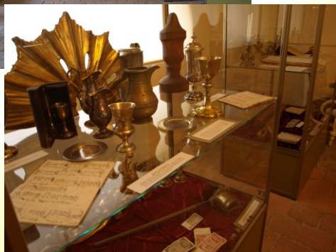
Muzeum protestantyzmu - eksponaty